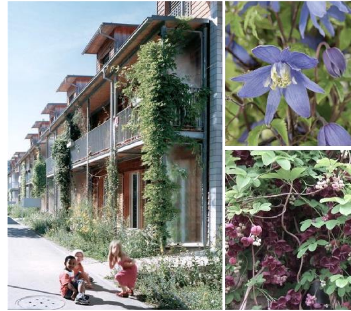
Balkonbegrünung Verschiedene Kletter- und Rankpflanzen wie Waldrebe und Fingerbl. Klettergurke an Balkongeländer und best. Gartenzaun