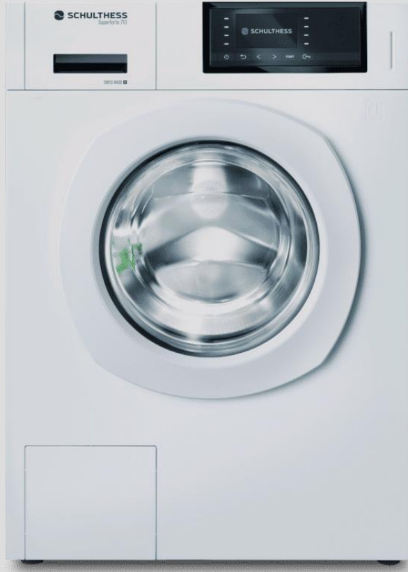
Weichwasser - Anschluss