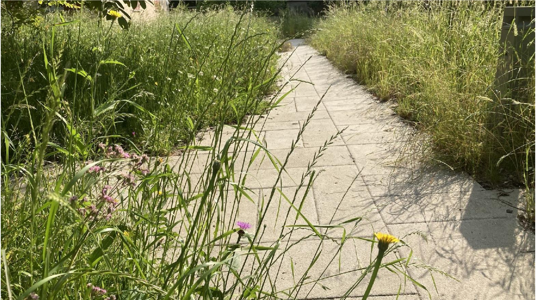
HITZE UND STARKREGEN