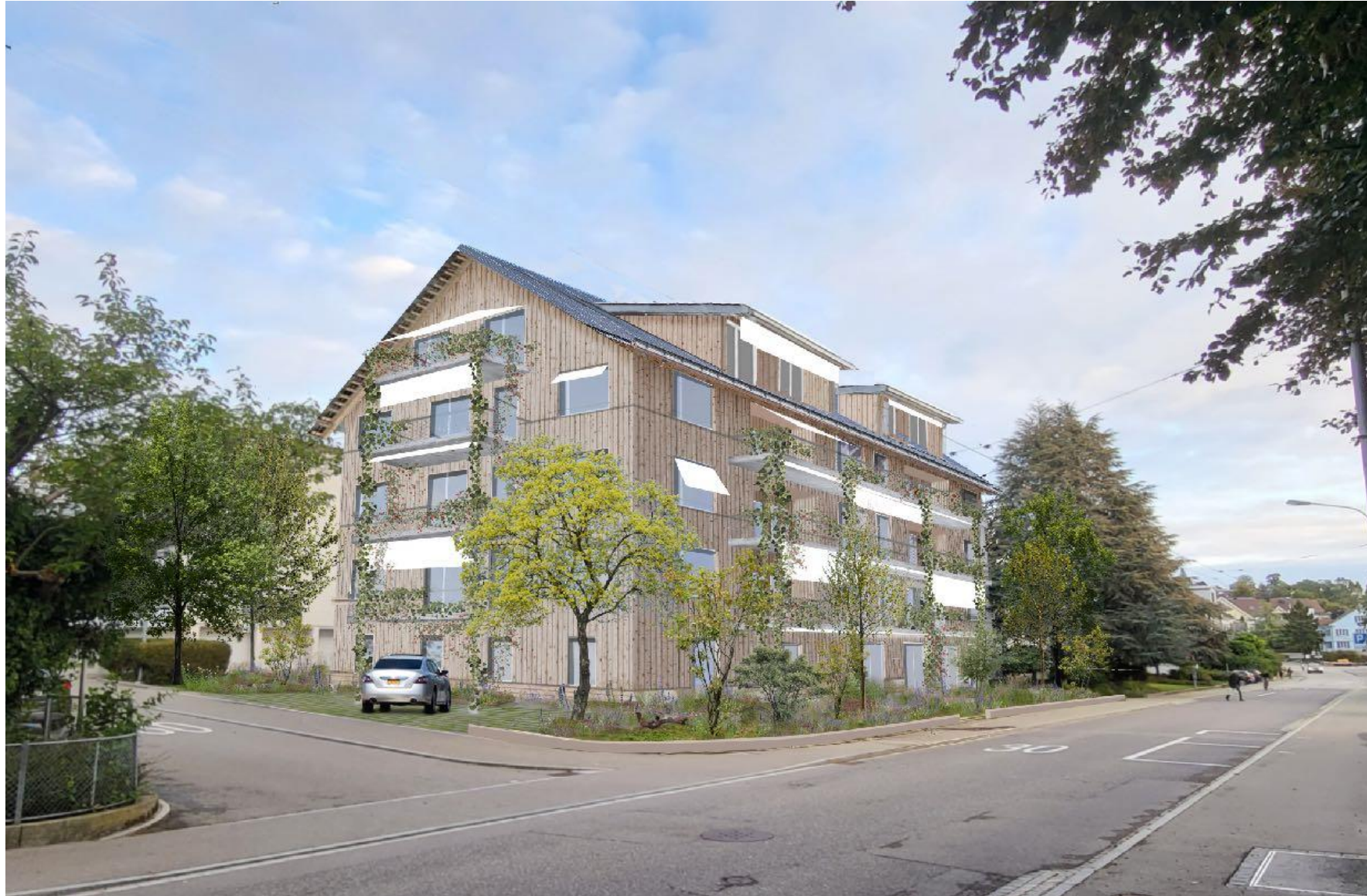
HITZE UND STARKREGEN