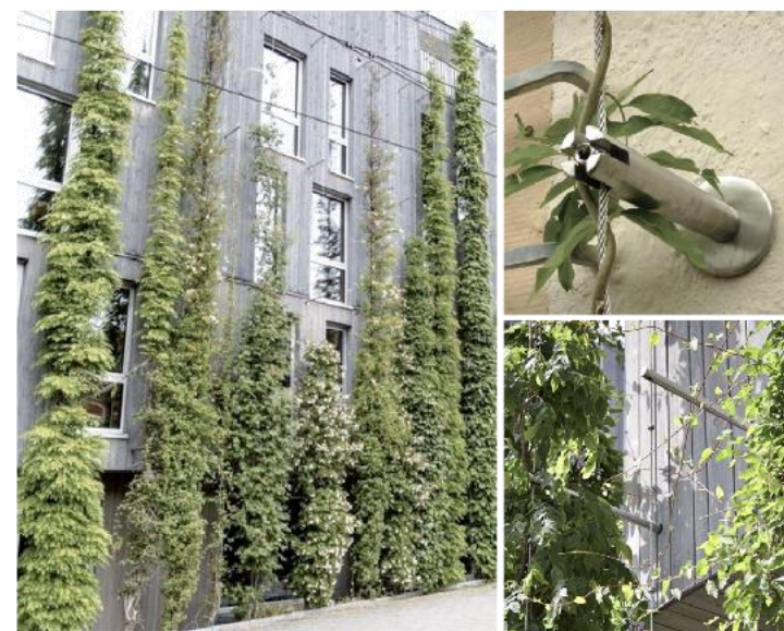
Fassadenbegrünung Mit Seilkonstruktion als Rankhilfe