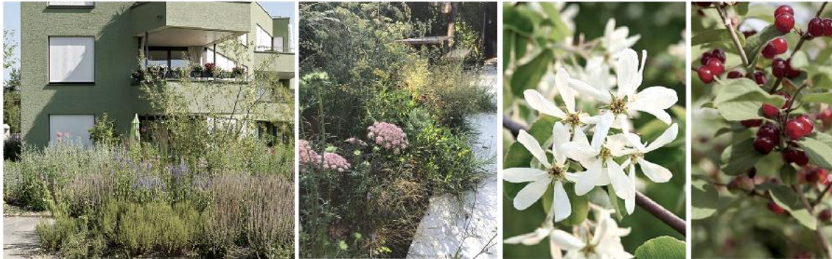
Pflanzflächen/Grüngürtel: Wildstaudenbepflanzung mit Strauchgruppen (Wildsträucher wie z.B. Sanddorn, Wildrosen und Purpurweiden)