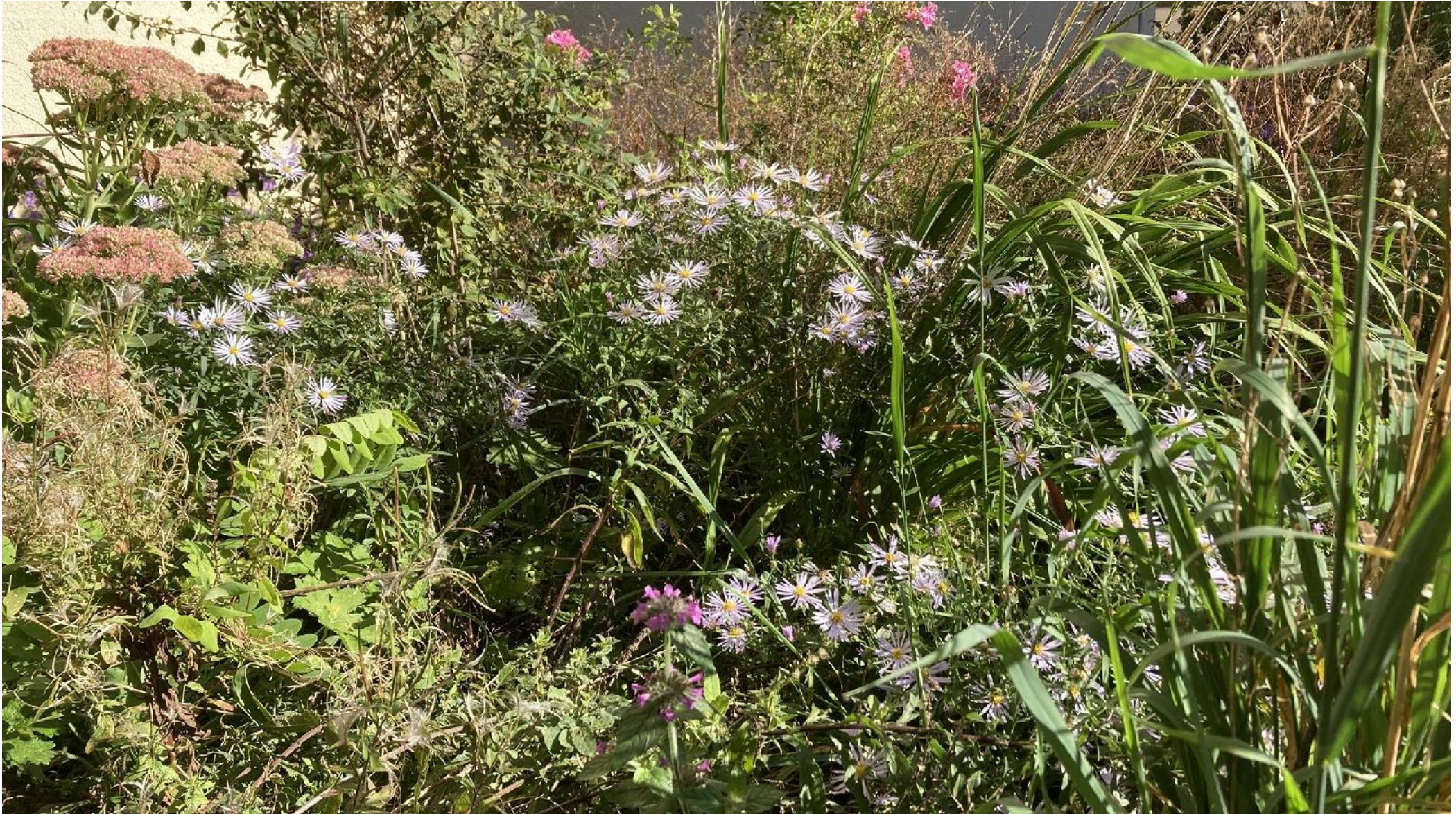
HITZE UND STARKREGEN