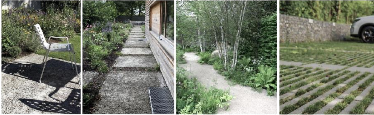
Belagsflächen: Sickerbeton für besetzte Fusswege, Chaussierung Bereich Sitzplätze/Gartenwege, Rasenliner Bereich Parkplätze.