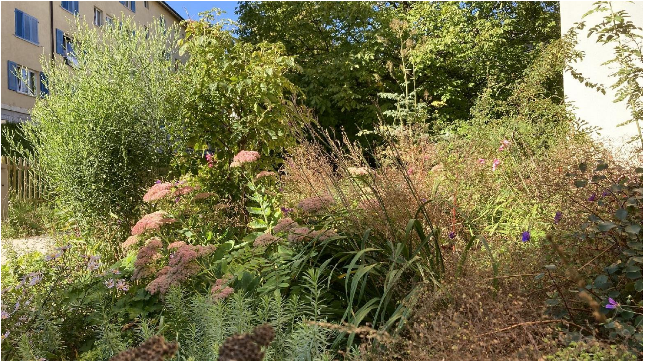
HITZE UND STARKREGEN