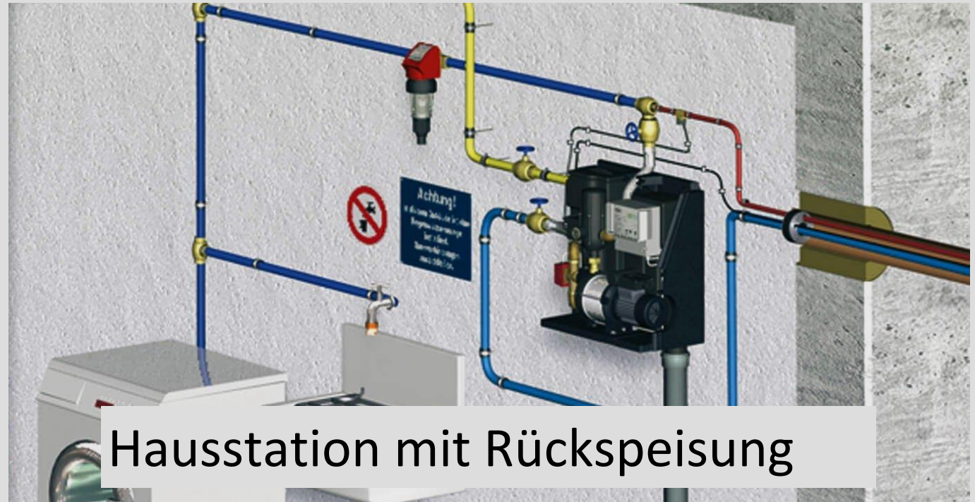
Hausstation mit Rückspeisung