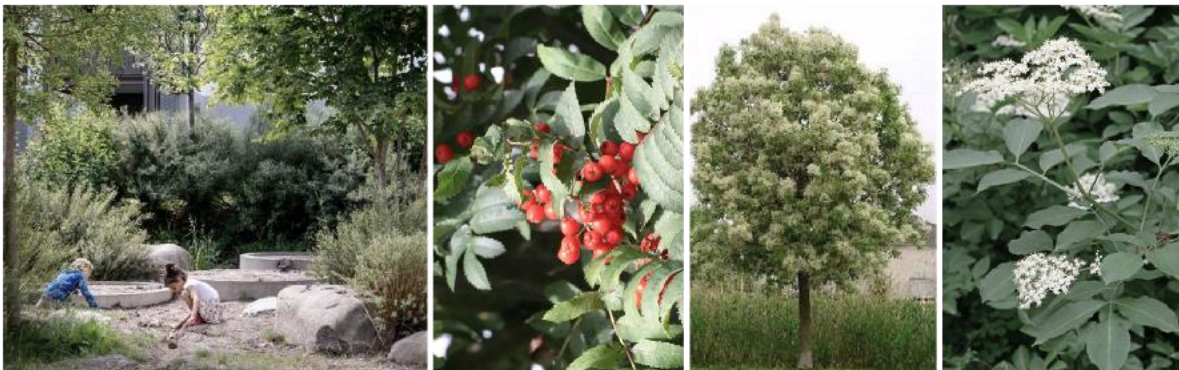
Sitzplatz- oder Spiel-Ecke mit Sträuchern